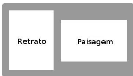
Forma correta de digitalização dos documentos

11.5.1. O candidato deverá digitalizar os documentos no formato RETRATO (vertical) ou PAISAGEM (horizontal), com as informações disponíveis para os avaliadores sem necessidade do uso do recurso de “girar visualização”, conforme imagens a seguir: